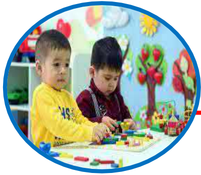
maktabgacha ta'lim va tarbiya;