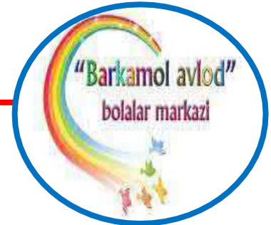
maktabdan tashqari ta'lim.

O'zbekiston Respublikasining "Ta'lim to'g'risida"gi Qonuni 7-modda.