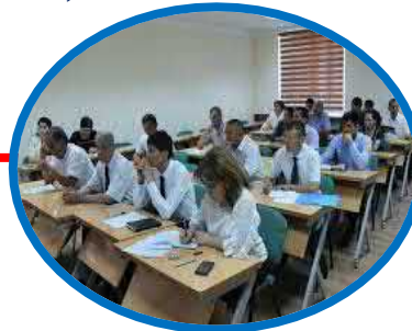
kadrlarni qayta tayyorlash va ularning malakasini oshirish;