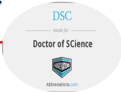
oliy ta'limdan keyingi ta'lim;