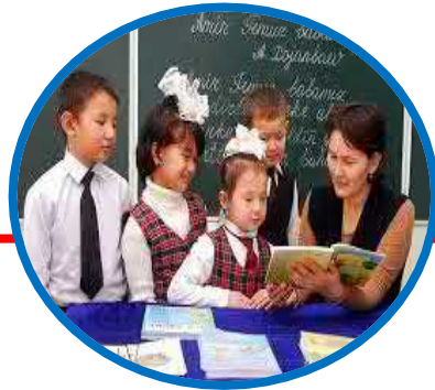
umumiy o'rta va o'rta maxsus ta'lim;