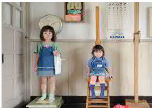
Bo'y, gavda massasi

Ilk va maktabgacha tarbiya yoshidagi jismoniy rivojlanish, bo'y, gavda massasi, bosh aylanasi, ko'krak qafasi kabi asosiy ko'rsatkichlarning tinimsiz o'zgarib turishi bilan xarakterlanadi.